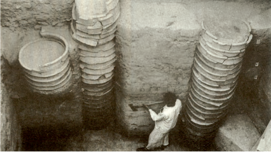
दिल्ली में मिला वलयकूप।

हड़प्पा की जल निकास व्यवस्था से यह कैसे भिन्न है?