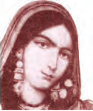
बेगम हज़रत महल

गया। कई महीनों तक उत्तरी और मध्य भारत के विस्तृत भूभाग पर विद्रोहियों का कब्ज़ा रहा।