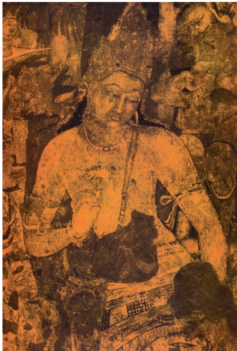
अजंता का एक चित्र

सातवीं-आठवीं शताब्दियों में ठोस चट्टान को काटकर एलोरा की विशाल गुफाएँ तैयार हुईं, जिनके बीच में कैलाश का विशाल मंदिर है। यह अनुमान करना कठिन है कि इंसान ने इसकी कल्पना कैसे की होगी या कल्पना करने के बाद अपनी कल्पना को रूपाकार कैसे दिया होगा। एलीफेंटा की गुफाएँ भी इसी समय की हैं जहाँ प्रभावशाली और रहस्यमयी त्रिमूर्ति बनी है। दक्षिण भारत में महाबलीपुरम् की इमारतों का निर्माण भी इसी समय हुआ था।