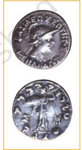
हिंद-यूनानी शासक मेनांडर का एक सिक्का

मध्य-एशिया में शक (सीदियन) लोग ऑक्सस (अक्षु) नदी की घाटी में बस गए थे। यूइ-ची सुदूर पूरब से आए और उन्होंने इन लोगों को उत्तर-भारत की ओर धकेल दिया। ये शक बौद्ध और हिंदू हो गए। यूइ-चियों में से एक दल कुषाणों का था। उन्होंने सब पर अधिकार करके उत्तर-भारत