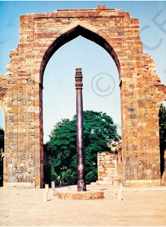
महरौली (दिल्ली) में कुतुबमीनार के परिसर में खड़ा लौह-स्तंभ, जिसका निर्माण लगभग 1500 साल पहले हुआ

जाता था। भारतीय रेशम उद्योग ने बाद में विकास किया, लेकिन बहुत नहीं। कपड़े को रँगने की कला में उल्लेखनीय प्रगति हुई और पक्के रंग तैयार करने के खास तरीके खोज निकाले गए। इनमें से एक नील का रंग था, जिसे अंग्रेज़ी में 'इंडिगो' कहते हैं। यह शब्द इंडिया से बना है और अंग्रेज़ी में यूनान के माध्यम से आया है।