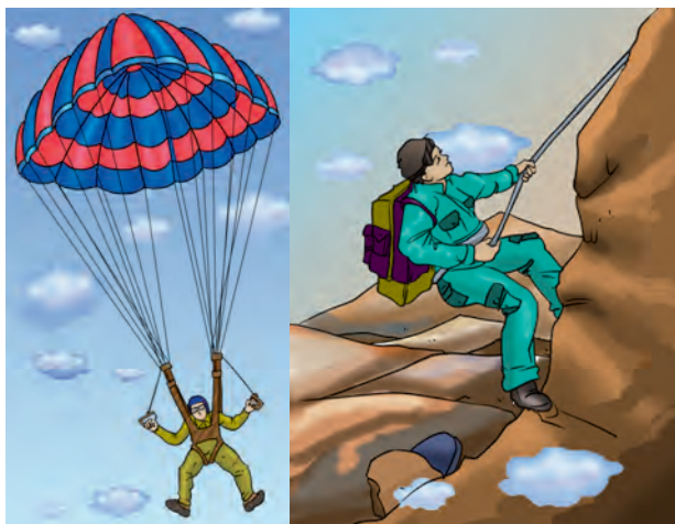
चित्र 3.4 : नाइलॉन रेशों के उपयोग।