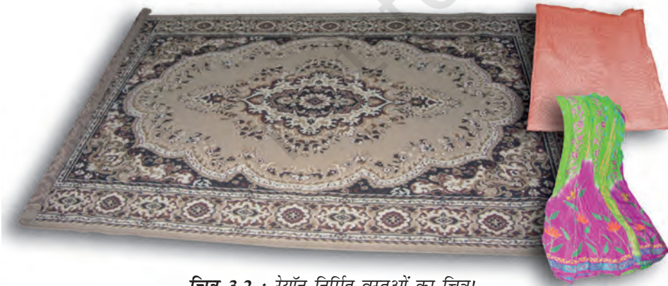
चित्र 3.2 : रेयॉन निर्मित वस्तुओं का चित्र।

आपने कक्षा VII में पढ़ा है कि रेशम कीट से प्राप्त किया जाता है। इसकी खोज चीन में हुई थी और इसे लम्बे समय तक कड़ी सुरक्षा में गोपनीय रखा गया। रेशम रेशे से प्राप्त कपड़ा बहुत मँहगा होता है परन्तु इसकी सुन्दर बुनावट (texture) ने प्रत्येक व्यक्ति को मोह लिया। रेशम को कृत्रिम रूप से बनाने के प्रयास किये गए। उन्नीसवीं शताब्दी के अन्तिम छोर पर वैज्ञानिकों को रेशम समान गुणों वाले रेशे प्राप्त करने में सफलता प्राप्त हुई। इस प्रकार का रेशा काष्ठ लुगदी के रासायनिक उपचार से प्राप्त किया गया। यह रेशा रेयॉन अथवा कृत्रिम रेशम कहलाया। यद्यपि रेयॉन प्राकृतिक स्रोत काष्ठ लुगदी से प्राप्त किया जाता है, यह एक मानव निर्मित रेशा है। यह रेशम से सस्ता होता है परन्तु इसे रेशम रेशों के समान बुना जा सकता है। इसे रंगों की कई किस्मों में रँगा जा सकता है। रेयॉन को कपास के साथ मिलाकर बिस्तर की चादरें बनाते हैं अथवा ऊन के साथ मिलाकर कालीन या गलीचा बनाते हैं। (चित्र 3.2)।