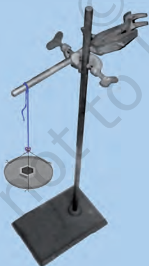
चित्र 3.5 : एक लोहे के स्टैण्ड पर क्लैम्प से लटकता हुआ एक धागा।

एक क्लैम्प युक्त लोहे का स्टैण्ड लीजिए। लगभग 60 सेमी लम्बा एक सूती धागा लीजिए। इसे क्लैम्प से बाँध दीजिए जिससे यह स्वतंत्र रूप से लटक जाए, जैसा चित्र 3.5 में प्रदर्शित है। मुक्त सिरे पर