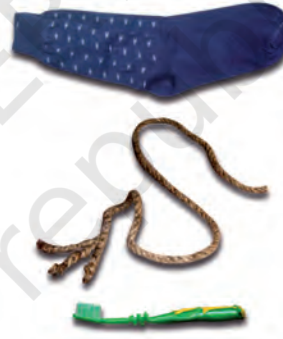
चित्र 3.3 : नाइलॉन से निर्मित विभिन्न वस्तुएँ।

हम नाइलॉन से निर्मित कई वस्तुओं को उपयोग में लाते हैं, जैसे— जुराबें, रस्से, तम्बू, दाँत साफ़ करने का ब्रुश, कारों की सीट के पट्टे, स्लीपिंग बैग (शयन थैला), परदे, आदि (चित्र 3.3)। नाइलॉन का उपयोग पैराशूट