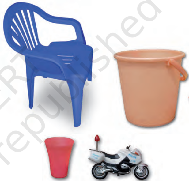
चित्र 3.7 : प्लास्टिक-निर्मित विभिन्न वस्तुएँ

प्लास्टिक की वस्तुएँ सभी सम्भव आकारों और साइजों में उपलब्ध हैं, जैसा आप चित्र 3.7 में देख सकते हैं। क्या आपको आश्चर्य नहीं होता कि यह कैसे संभव है? तथ्य यह है कि प्लास्टिक आसानी से साँचे में ढाला जा सकता है अर्थात् इसे कोई भी आकार दिया जा सकता है। प्लास्टिक का पुनः चक्रण हो सकता है, इसे पुनः प्रयुक्त किया जा सकता है, इसे रँगा और पिघलाया जा सकता है, इसे बेलकर चद्दरों में बदला जा सकता है अथवा इसकी तारें बनायी जा सकती हैं। इसलिए इनके इतने विभिन्न प्रकार के उपयोग हैं।