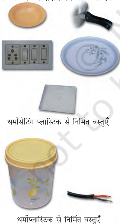
थर्मोसेटिंग प्लास्टिक से निर्मित वस्तुएँ

दूसरी ओर, कुछ प्लास्टिक ऐसे हैं जिन्हें एक बार साँचे में ढाल दिया जाता है तो इन्हें ऊष्मा देकर नर्म नहीं किया जा सकता। ये थर्मोसेटिंग प्लास्टिक कहलाते हैं। दो उदाहरण हैं - बैकेलाइट और मेलामाइन। बैकेलाइट ऊष्मा और विद्युत का कुचालक है। यह बिजली के स्विच, विभिन्न बर्तनों के हथ्थे, आदि बनाने में काम आता है। मेलामाइन एक बहुउपयोगी पदार्थ है। यह आग का प्रतिरोधक है तथा अन्य प्लास्टिक की अपेक्षा ऊष्मा को सहने की अधिक क्षमता रखता है। यह फर्श की टाइलें, रसोई के बर्तन और कपड़े बनाने के उपयोग में लिया जाता है जो आग का प्रतिरोध करते हैं। चित्र 3.8 में थर्मोप्लास्टिक और थर्मोसेटिंग प्लास्टिक के विभिन्न उपयोगों को प्रदर्शित किया गया है।