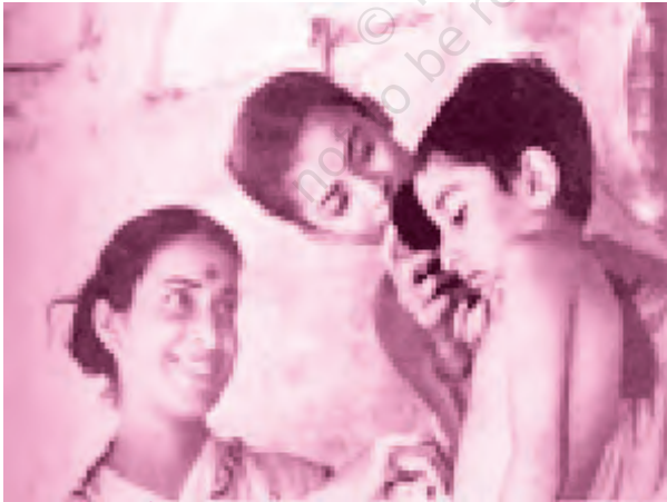
पथेर पांचाली फ़िल्म का एक दृश्य

शूटिंग की शुरुआत में ही एक गड़बड़ हो गई। अपू और दुर्गा को लेकर हम कलकत्ता* से सत्तर मील पर पालसिट नाम के एक गाँव गए। वहाँ रेल-लाइन के पास