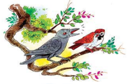
एते द्वे मित्रे स्तः।