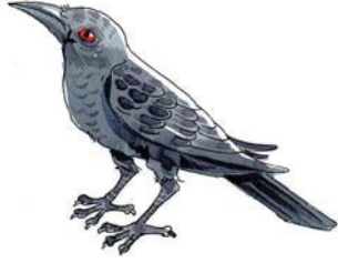
एषः काकः अस्ति।