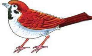
एषा चटका अस्ति।